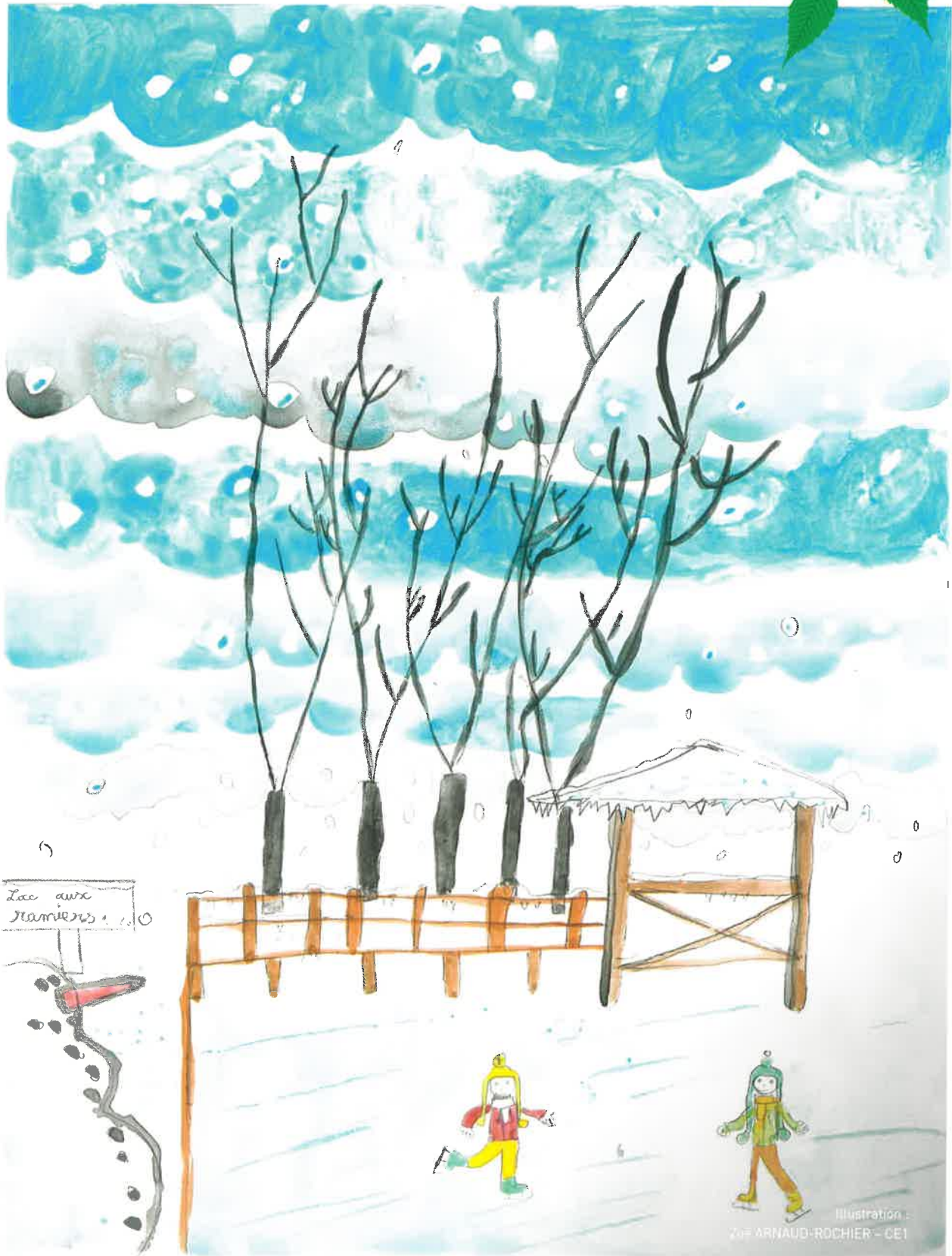
Illustration : 20- ARNAUD-ROCHIER - CE1