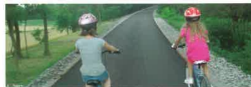
La Payre, voie douce d'Ardèche

Suite à l'adhésion de la Communauté de Commune du Pays de Vernoux au dispositif Territoire à Energie Positive (TEPOS) en 2013, une convention a été passée avec le ministère de l'écologie pour bénéficier de fonds de financement à la transition énergétique pour la croissance verte.