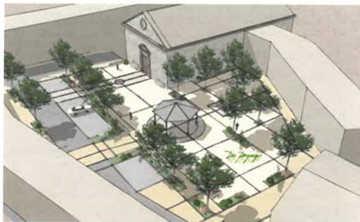
Projet de la place du Temple en cours de finalisation.