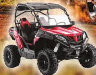
Z FORCE 550 / 800